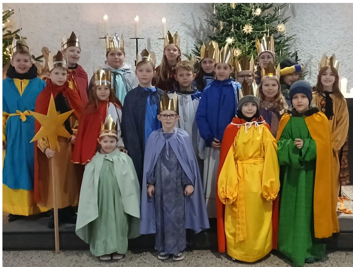
St. Laurentius: Sternsinger 2026