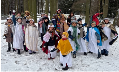
St. Peter und Paul: Sternsinger 2026