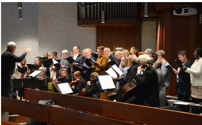
Auftritt vom Kirchenchor St. Laurentius im Dezember 2025.

Ein neues Projekt für das Jahr 2026 steht aber nun schon an: Zusammen mit dem Jugendchor St. Peter und