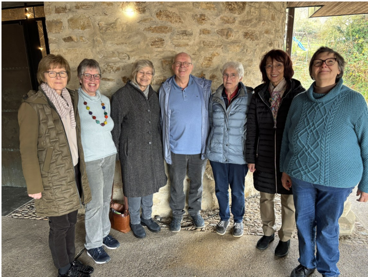
Die neue Caritas-Konferenz von St. Walburga ab 2025