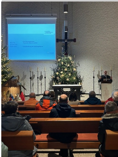
Eine Informationsveranstaltung zum Bistumsprozess fand in Löhne statt.