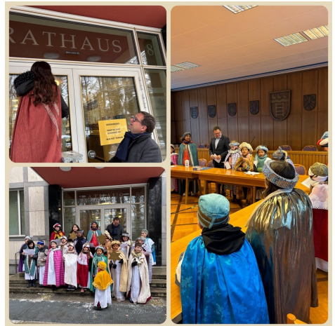
Die Sternsinger im Rathaus Bad Oeynhausen

Für das Sternsinger-Vorbereitungsteam M. Beckmann