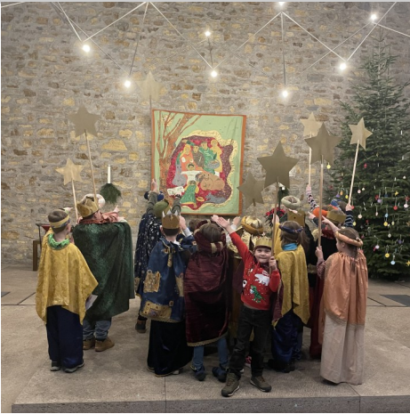
St. Walburga: Sternsingeraktion 2026