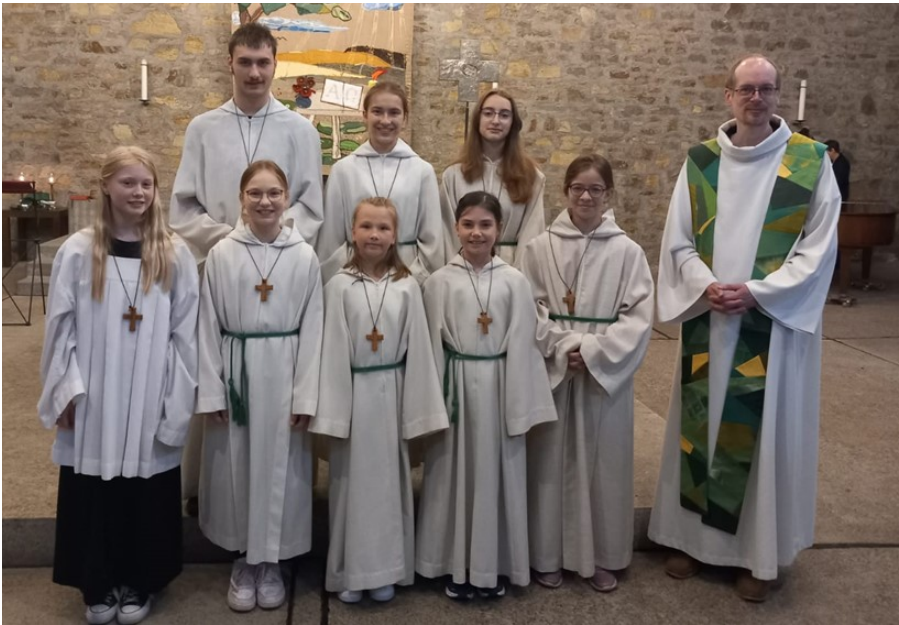
Die MessdienerInnen 2024 in St. Walburga