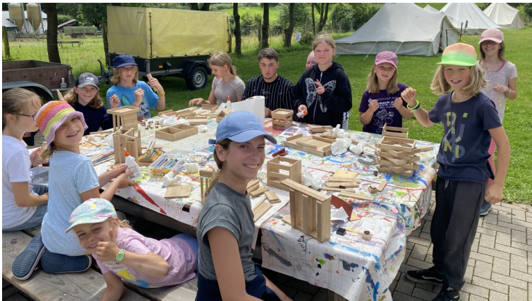
Zu vielen Themen wurden Workshops angeboten.

Wir freuen uns auf euch! Euer Leitungsteam