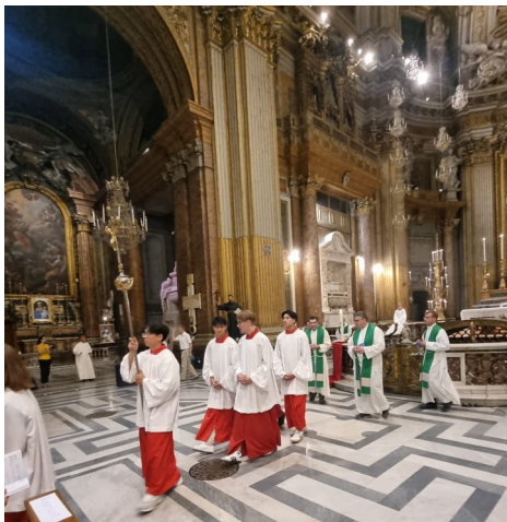
Vier Messdiener aus St. Peter und Paul durften bei dem Eröffnungsgottesdienst dienen.

Vom 28. Juli bis 2. August waren wir Messdiener der Kirchengemeinde St. Peter und Paul in Rom bei der internationalen Messdienerwallfahrt. Wir konnten viele schöne Erfahrungen sammeln und damit fingen wir direkt sonntags, am Tag unserer Ankunft an. Zuallererst stand vier von uns die Ehre zu, beim Eröffnungsgottesdienst in der Santi XII Apostoli Basilika zu dienen. Die Besichtigung des Trevi-Brunnens, des Pantheons und der Altstadt Roms folgten darauf.