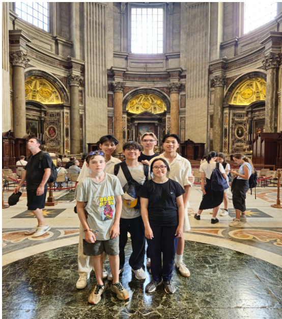
Die Messdienerin und Messdiener von St. Peter und Paul, die an der Messdienerwallfahrt nach Rom teilgenommen haben (Foto privat).