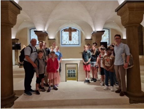
Die Gruppe der Krypta im Paderborner Dom (Foto privat).