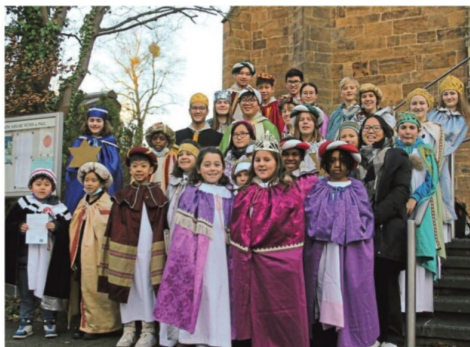
Die Sternsinger von St. Peter und Paul