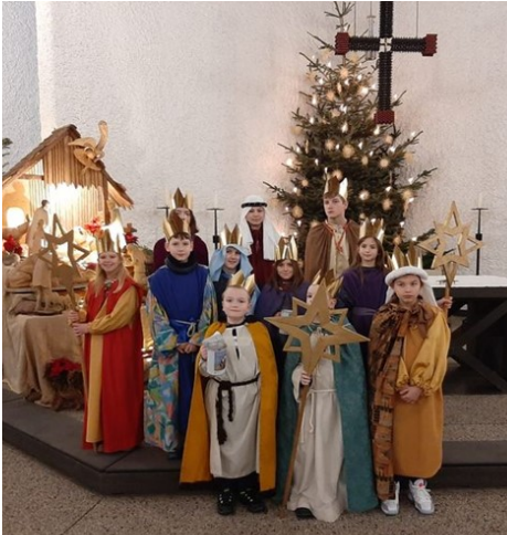
Die Sternsinger von St. Laurentius

Der Samstag stand dann ganz im Zeichen der Hausbesuche. An die 100 Haushalte wurden von drei Sternsingergruppen besucht. Außerdem wurden ca. 30 Segensbriefe versandt.