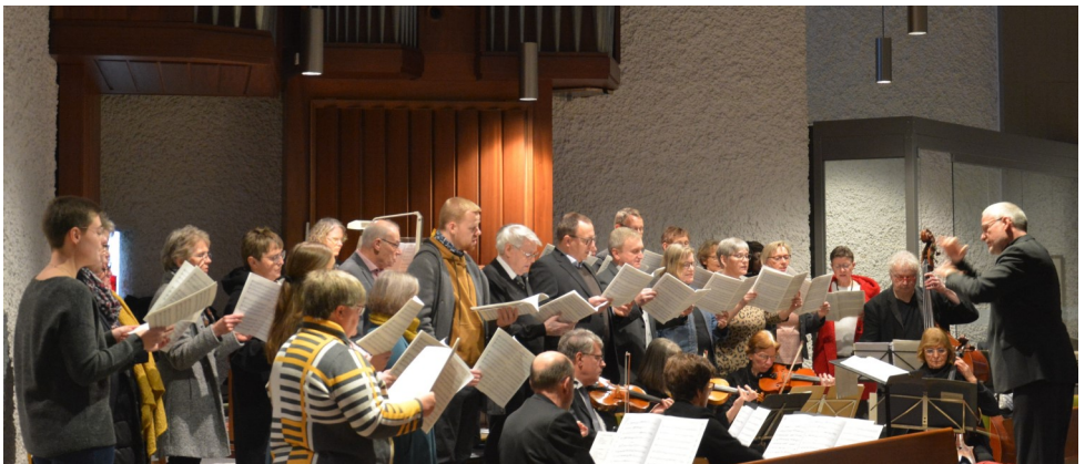
Der Kirchenchor von St. Laurentius, Löhne (Foto privat).