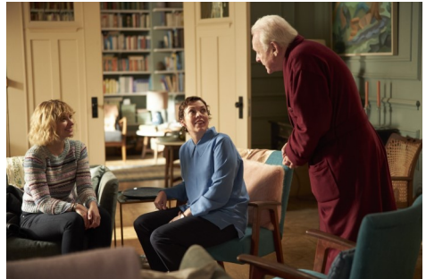
Bildrechte Filmfotos: The Father: © TOBIS Film