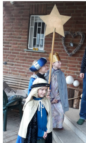
Drei Sternsinger von St. Walburga.