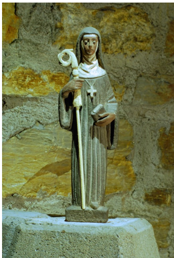
Statue der Heiligen Walburg in der Kirche St. Walburga, Porta Westfalica.

Anschließend wird zu einem Empfang und einem Vortrag mit Pastor Richardt zum Thema „Liturgische Kleidung“ eingeladen.