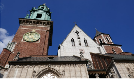
Einladung zur Reise nach Krakau