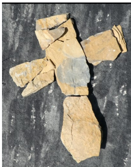
Das kleine Kreuz aus Steinen der Walburga-Kirche.