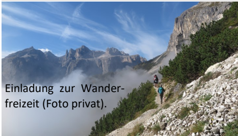
Einladung zur Wanderfreizeit.