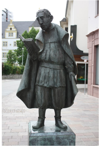
Friedrich von Spee, auf dem Foto als Statue in Paderborn, schrieb das Lied „Die ganze Welt, Herr Jesu Christ, in ihrer Urständ fröhlich ist“.

6) Die ganze Welt, Herr Jesu Christ, Halleluja, Halleluja, in deiner Urständ fröhlich ist. Halleluja, Halleluja.