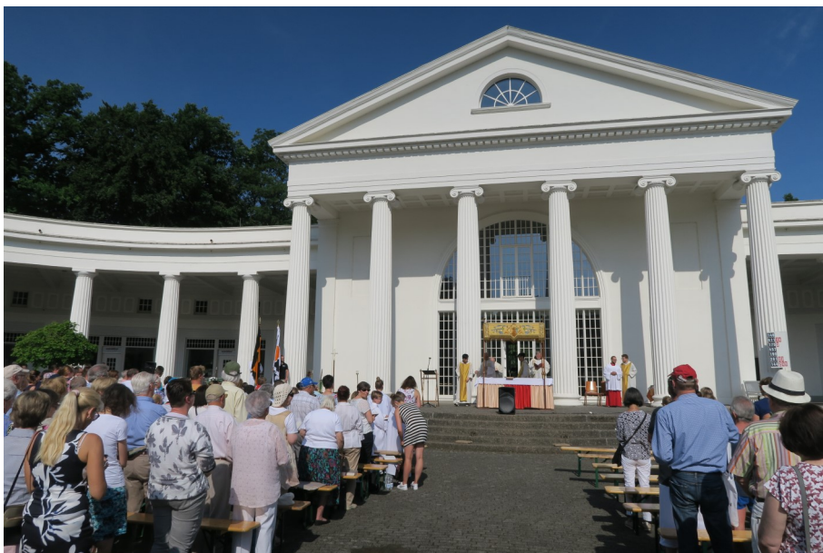
Der Fronleichnamsgottesdienst wird vor der Wandelhalle stattfinden (Archivfoto von 2018).