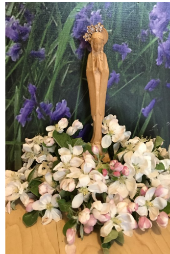
Auf dem Foto sieht man eine mit Blumen geschmückte Marienfigur.

Peter Weidemann, in: Pfarrbriefservice.de