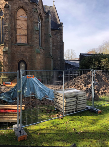
Seit März 2021 ist an der Kirche St. Peter und Paul eine Großbaustelle (Foto privat).

ment steht. Sollte das so sein, können die Sanierungsarbeiten an der Fassade und im Inneren der Oberkirche durchgeführt werden. Über den Verlauf der Bauarbeiten werden wir regelmäßig berichten.