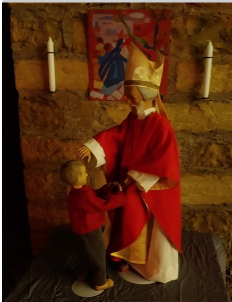
Installation „Zeichen der Hoffnung“, entwickelt von den Jugendlichen in St. Walburga