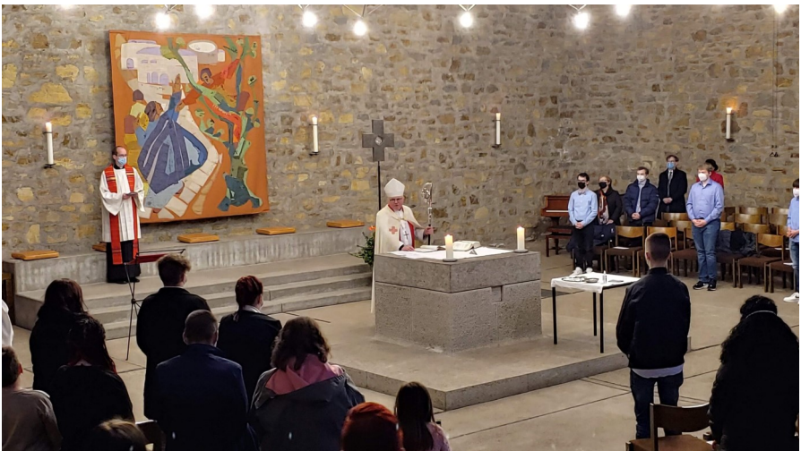
Firmung in St. Walburga mit Weihbischof Berenbrinker