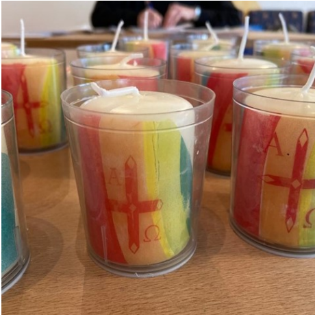
Selbstgebastelte Kerzen für die FirmbewerberInnen als Nikolausgeschenk

Am 05. Dezember 2020 trafen sich einige der diesjährigen Firmkatecheten aus Vlotho und Löhne im Haus der Begegnung in Löhne, um eine Kleinigkeit für die Firmbewerber zu basteln. Aufgrund der Corona-Pandemie und den daraus resultierenden Auflagen waren Präsenzveranstaltungen mit den Firmbewerbern seit November nicht mehr möglich.