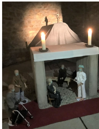
Aufgebaute Szene in St. Walburg