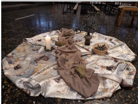
Der vorbereitete Weg für das Kreuz

Mit dem Gedanken, im Kreuz ist Heil und Erlösung, wollen wir in diesem Jahr in St. Johannes Ev. durch die Fastenzeit gehen. Unsere Gottesdienstbesucher haben die Möglichkeit, auf dem vorbereiteten Weg symbolisch für eine Fürbitte ein kleines Kreuz zu legen.