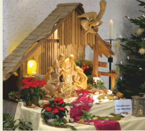
St. Laurentius, Löhne