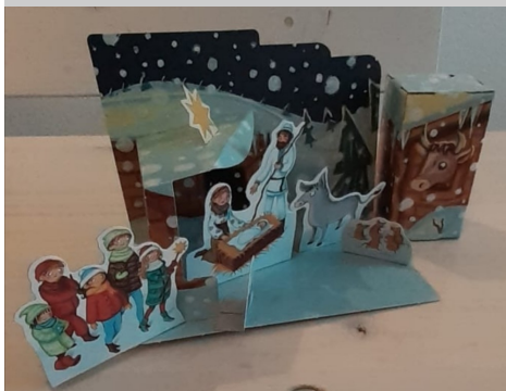
Das Spendenkästchen 2020/2021.

„Kinder helfen Kindern – und ich bin dabei!“ lautet das Motto des Weltmissionstags der Kinder.