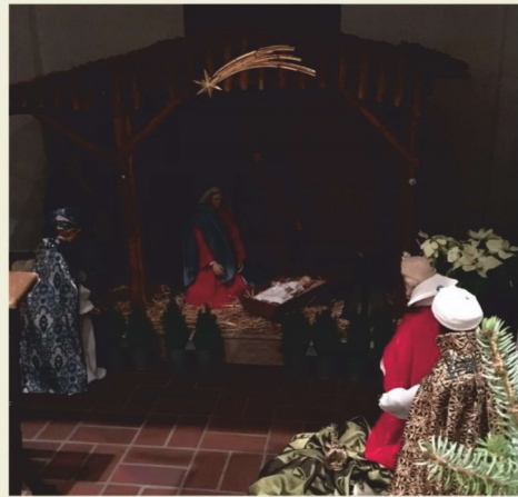
Heilig Kreuz, Vlotho