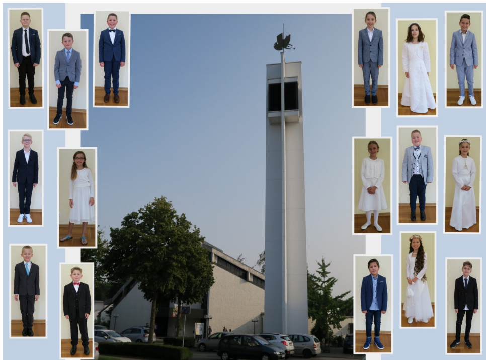
Die Erstkommunion-Kinder 2020

Aufgrund der Corona-Zeit musste die Erstkommunionfeier vom 10. Mai auf den 13. September verschoben werden, die unter Corona-Auflagen in zwei Gottesdiensten in der Laurentiuskirche gefeiert wurde. Erstmals wurden beide Gottesdienste auch via Livestream ausgestrahlt, damit die