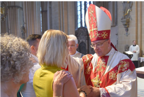
Eine Erwachsenenfirmung im Erzbistum Paderborn

Kontakt: Telefon: 0571/710554 oder Ulrich.Geschwinder@web.de