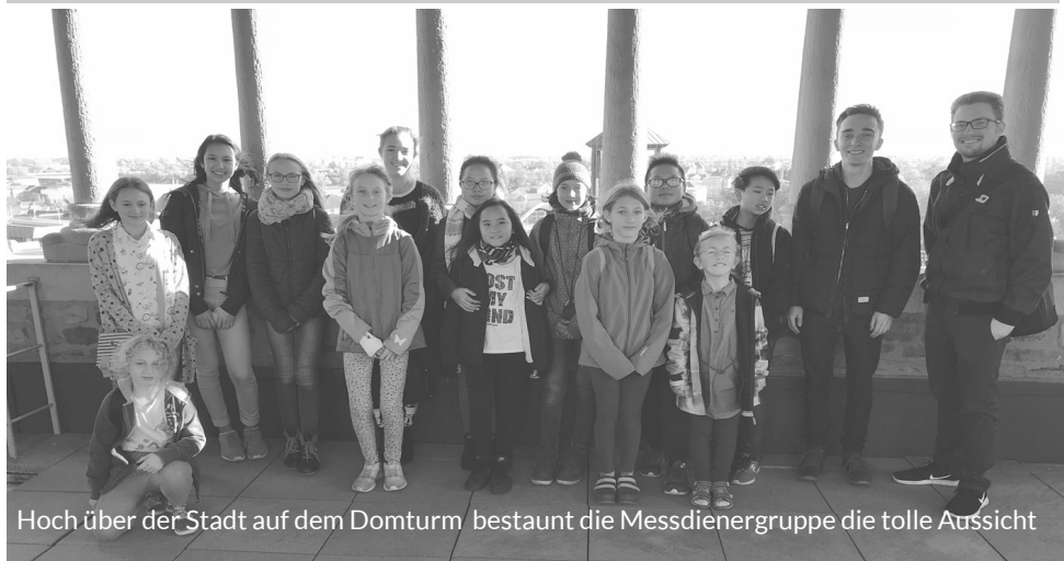
Hoch über der Stadt auf dem Domturm bestaunt die Messdienergruppe die tolle Aussicht

Am 14. Oktober trafen sich 15 Ministranten und Leiter am Bahnhof Bad Oeynhausen, um auf dem Messdienerausflug Minden und den Mindener Dom bei bestem Wetter kennenzulernen.